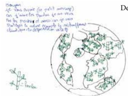
Dessin de Mila

Le papier de ce journal a été gracieusement offert par la société Arjowiggins.