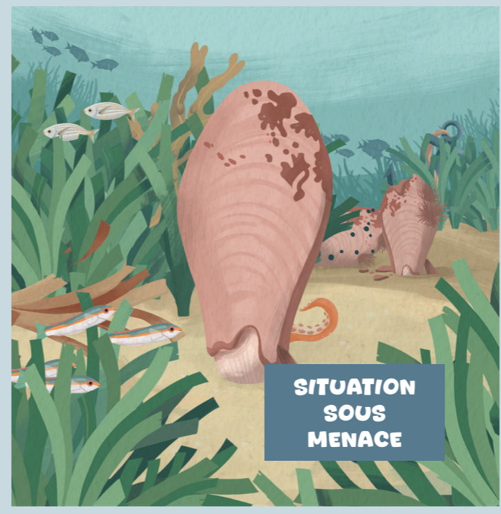
Réponses : les bulles, le tentacule, l'ancre, les algues invasives, la nacre couchée, les herbiers de posidonie sur la gauche, la nacre cassée à droite, la coquille de la nacre au centre.

Trouve les huit menaces qui pèsent sur la grande nacre et entoure-les.