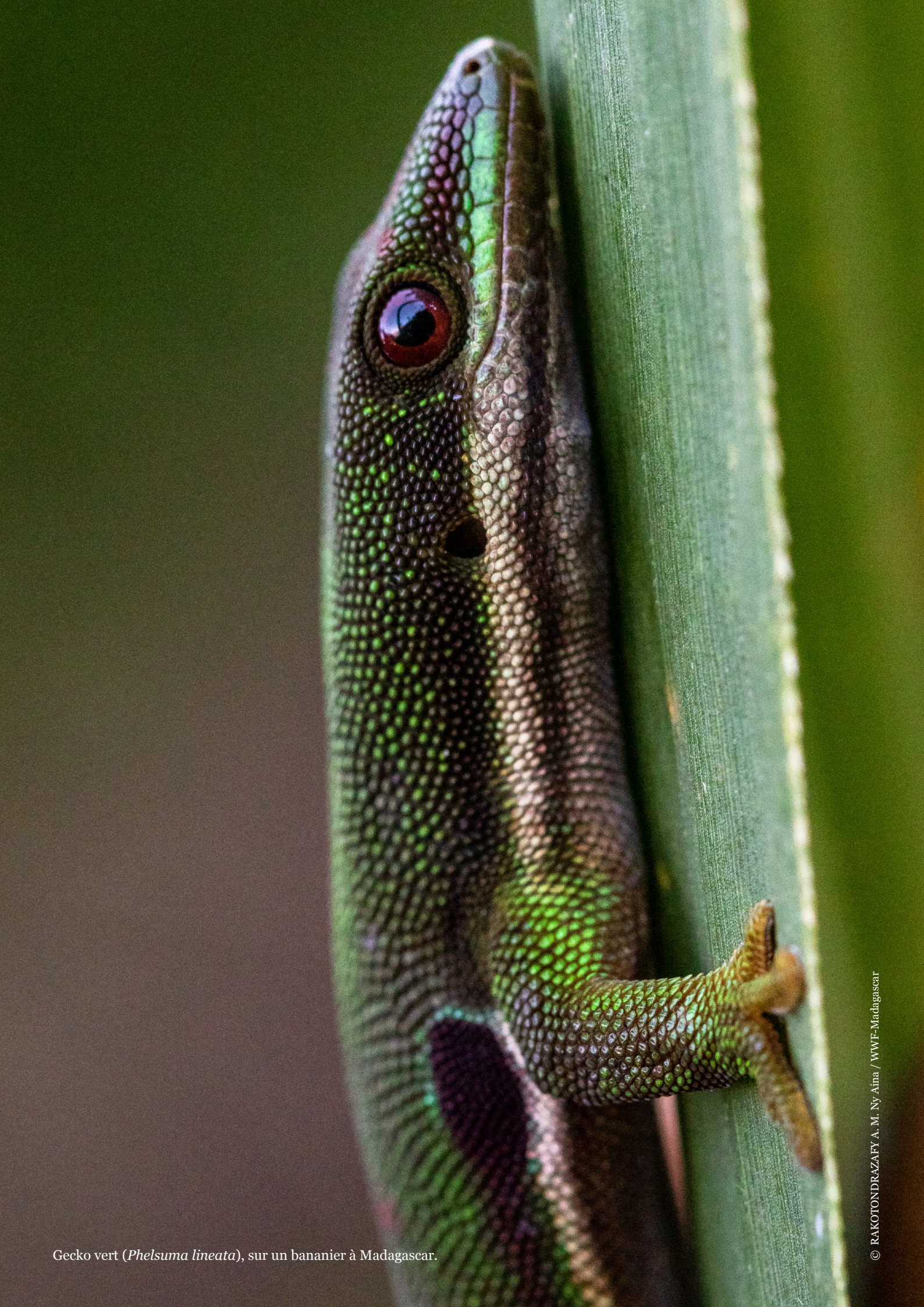
Gecko vert ( Phelsuma lineata ), sur un bananier à Madagascar.